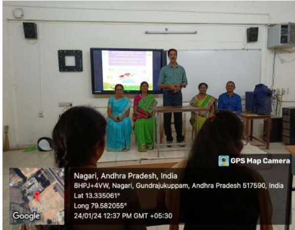
Nagari, Andhra Pradesh, India 8HPJ+4VW, Nagari, Gundrajukuppam, Andhra Pradesh 517590, India Lat 13.935061° Long 79.582055° 24/01/24 12:37 PM GMT +05:30