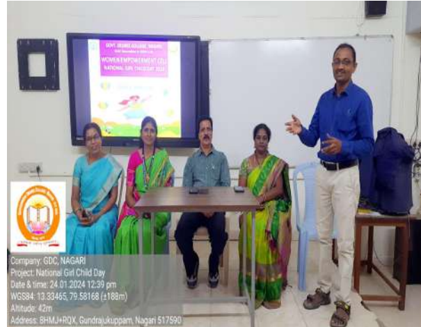
Company: GDC, NAGARI Project: National Girl Child Day Date & Time: 24.01.2024 12:39 pm WGS84: 13.93465, 79.58168 (±188m) Altitude: 42m Address: BHMJ+RQX, Gundrajukuppam, Nagari 517590