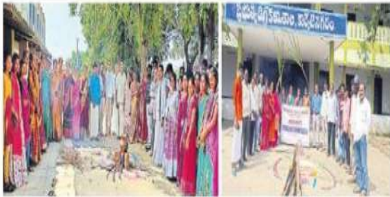
నగర, కార్తీకదినంలోని ఢిల్లీ కళాశాల ఆవరణలో సంబరాలు జరుపుకున్న అధ్యాపకులు, విద్యార్థులు