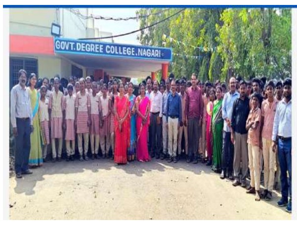
Students visit to the Departments, Labs and Library