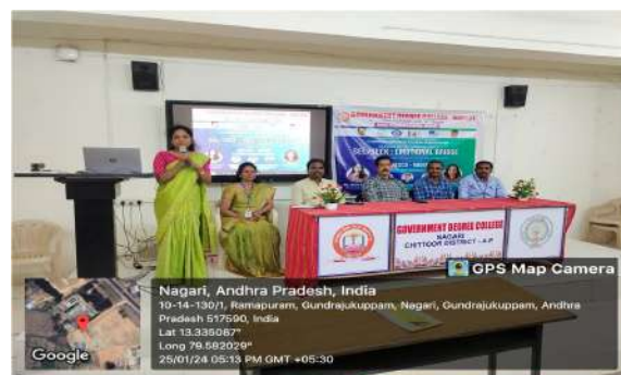
One of the faculty participants giving feedback in the valedictory on 25.01.2024