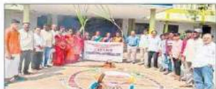
కార్తీకదినంలో: వేడుకల్లో అధ్యాపకులు, విద్యార్థులు