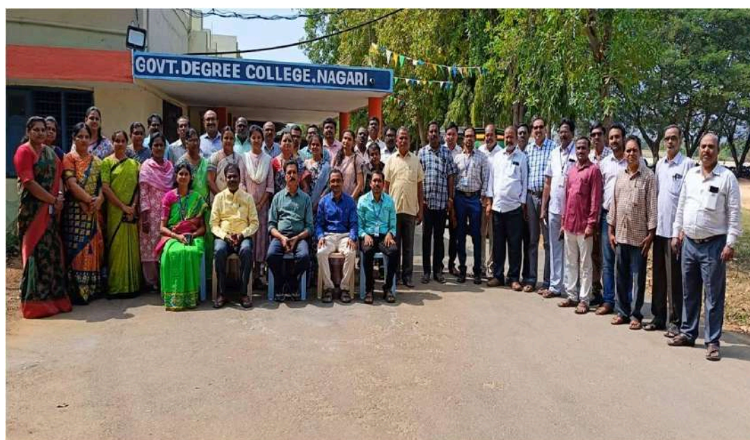
Faculty participants along with the principal, Vice-Principal, Coordinator and Master Trainers on 24.01.2024