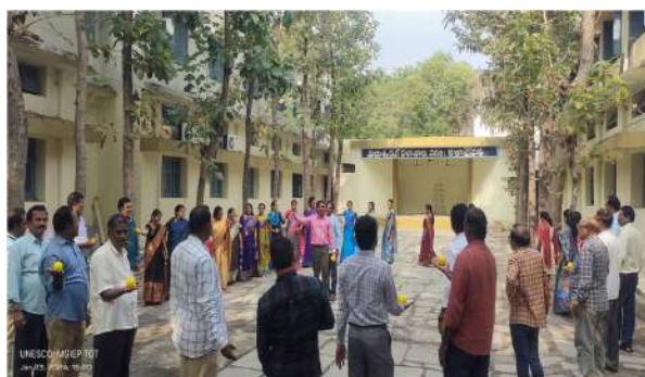
Outdoor activity with Stress Balls