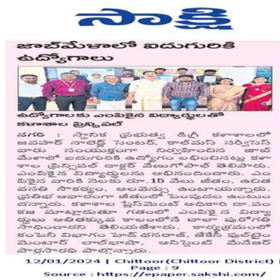
News coverage in Sakshi