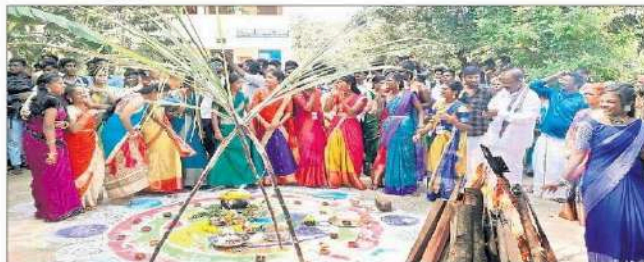
పుత్తూరు: గొబ్బెమ్మలతో వేడుకలను విద్యార్థులు