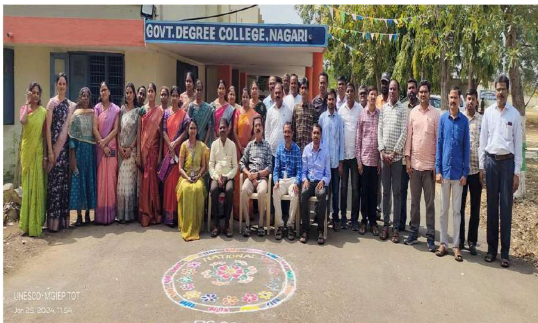
Faculty participants on 25.01.2024 along with NRC Principal, Vice-Principal, Coordinator and Master Trainers