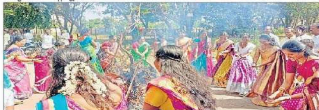
నగర: భోగి మంటల చుట్టూ గొబ్బెమ్మలతో వేడుకలను విద్యార్థులు