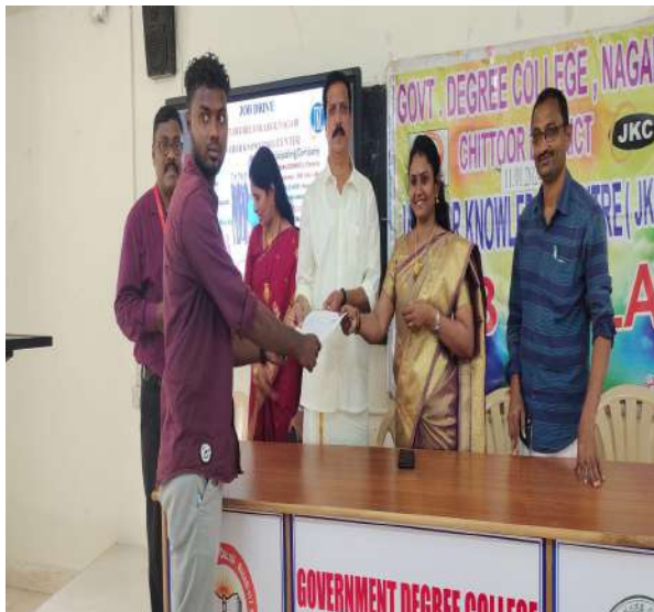
Selected candidate receiving offer letter from the Principal and staff