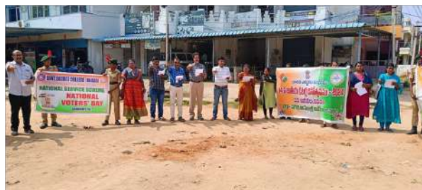
Human Chain formed to take the Voters Day Pledge