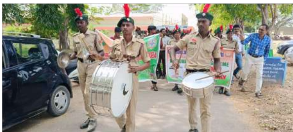
Drums by the NCC Cadets to grab the attention of the public