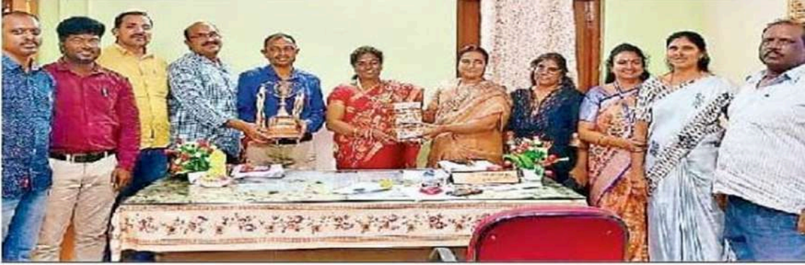
అధ్యాపకులను అభినందిస్తున్న వైస్ చీఫ్, ప్రిన్సిపల్, అధ్యాపకులు